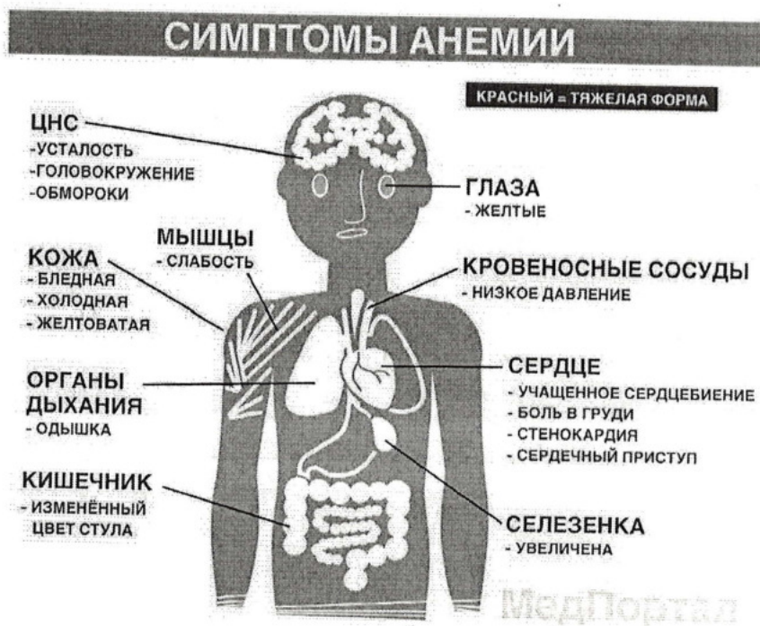
Рисунок 1 – Симптомы анемии

Пример оформления рисунка (см. Рисунок 1):